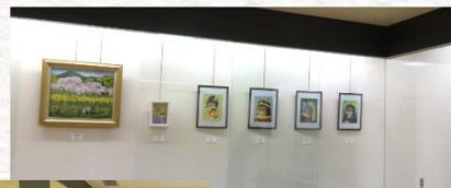
手作り作品展 「魔法の手」 展示風景